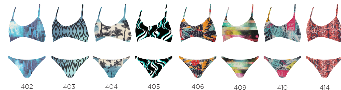
FIT AQ 409