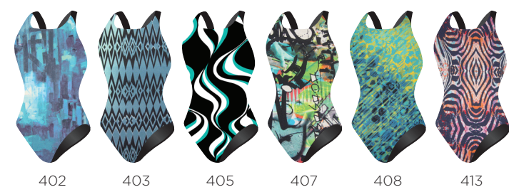
TRAD AQ 402