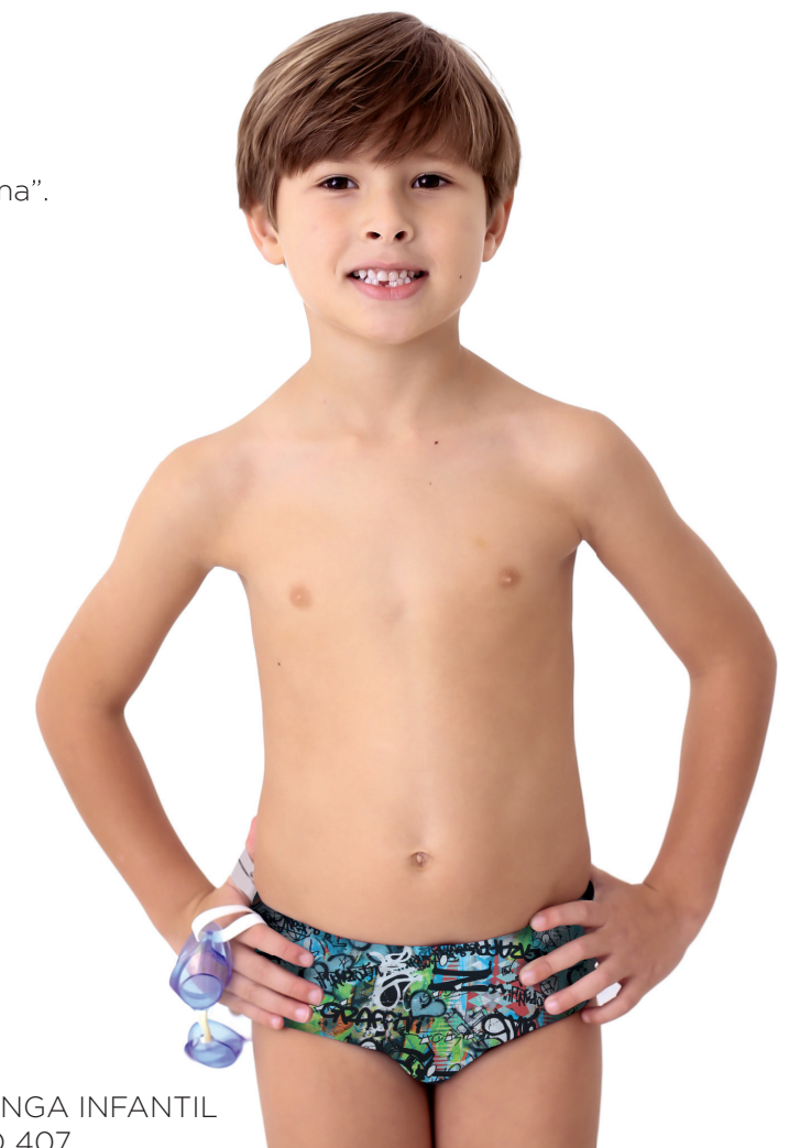
SUNGA INFANTIL AQ 407