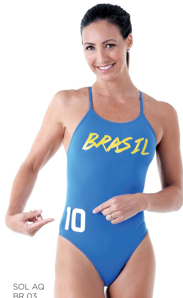
SOL AQ BR 03