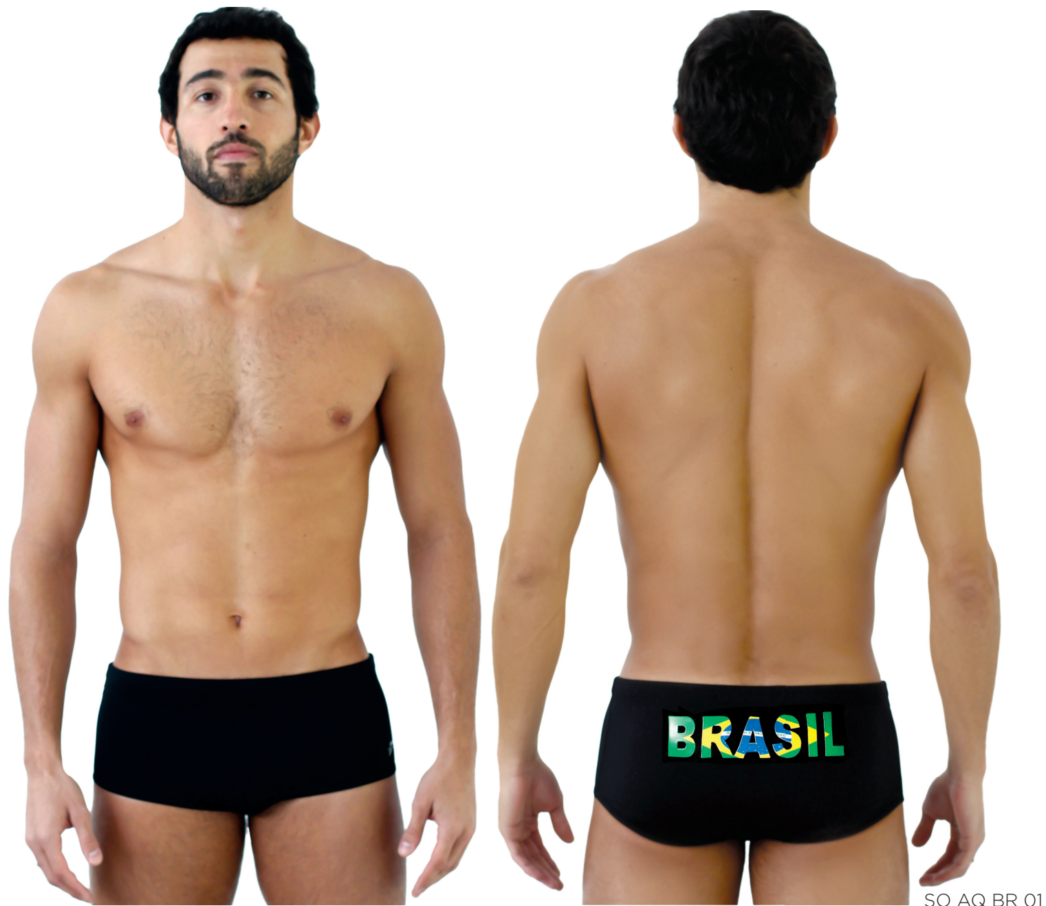
SO AQ BR 01