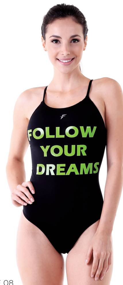
SOL AQ F 08